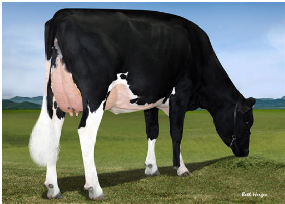
FAIRMONT TUFFENUFF RIDGE GRANDDAM