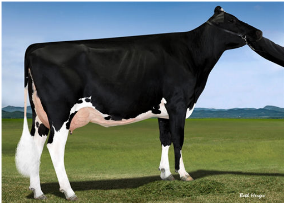
FAIRMONT TUFFENUFF RIDGE GRANDDAM